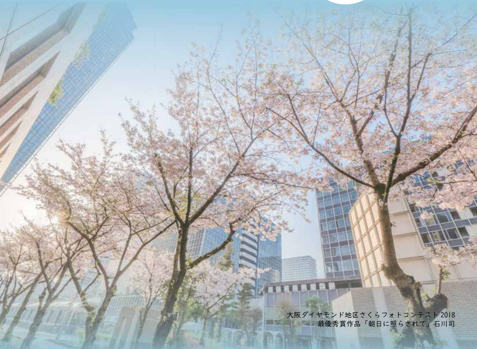
大阪ダイヤモンド地区さくらフォトコンテスト 2018 最優秀賞作品「朝日に照らされて」石川司