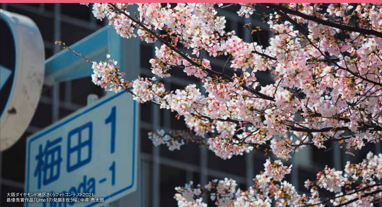
大阪ダイヤモンド地区さくらフォトコンテスト2021 最優秀賞作品「Ume1の発展を祝う桜」中井 亮太郎