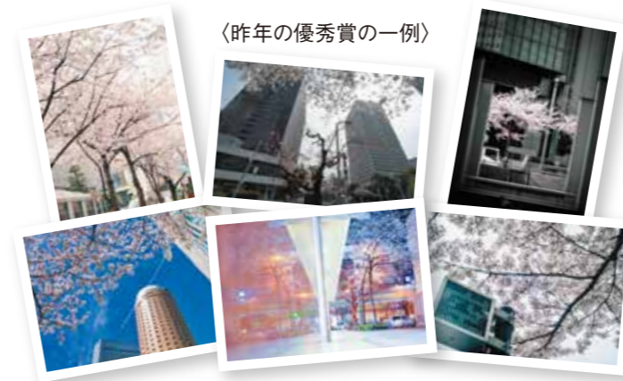
〈昨年の優秀賞の一例〉

審査方法 主催者および特別審査員にて審査を行い、入選者を決定します。 特別審査員：鍛冶谷 直記 / 写真家 (ビジュアルアーツ専門学校大阪 写真学科 講師) ※結果発表は入選者にダイレクトメッセージまたはメールで直接ご連絡します。(5月下旬予定) ※入選通知後、指定の期限までに、ご連絡先、賞品お届け先等、必要事項を指定の方法でご連絡ください。 ※ご連絡が指定の期限内にない場合は入選を無効とさせていただきますのでご注意ください。